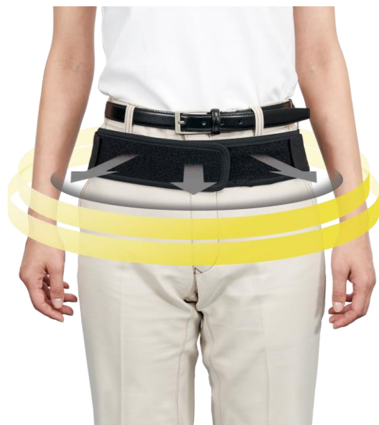
二重ベルト構造で腹圧を上げ 腰部の負担を軽減

(※2) 椎間板にかかる負担値は、立体姿勢を100%とした比較値となります。 ※出典：Nachemson A: The lumbar Spain. An orthopaedic challenge. Sp ain 1:59-71,1976