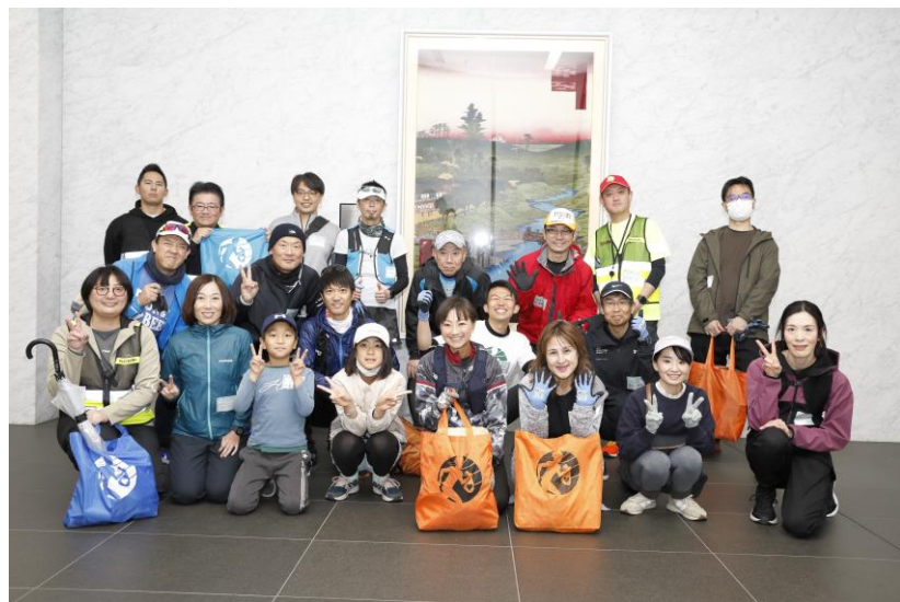
当日は20名の参加者にご参加いただき、約7.5kgのゴミを回収しました

今後もミドリ安全は、運動時の栄養補給や熱中症対策への啓蒙を続けると共に、地域社会への貢献と環境保護への意識向上を目的としたイベントを続けていく予定です。