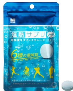
プロギング中の栄養補給にも最適 「塩熱サプリ®ソーダ味」(30g/24粒入り)

プロギングやクリーンストライド活動時にも携帯でき、つい忘れがちな冬場の栄養補給にも最適です。 (* )1袋80g入りとして累計販売総量より換算