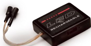
「LEDライトボックス」2,330円（税別）