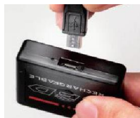
USB Bタイプで 繰り返し充電可能