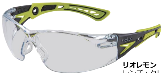
リオレモン レンズ：クリア (JIS) / コッパー (ANSI)