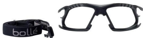
ガasket・ストラップ (別売り)