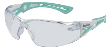
スカンジナビアミント レンズ：クリア (JIS)