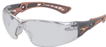
トウキョウサクラ レンズ：クリア (JIS)