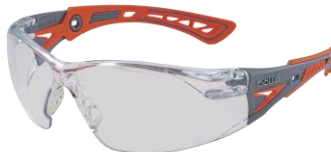
グラナダオレンジ レンズ：クリア (JIS)