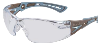
シアトルモカ レンズ：クリア (JIS) / コッパー (ANSI)