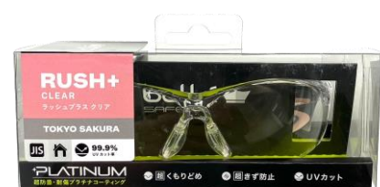
トウキョウサクラ リニューアルパッケージ

「RUSH+」は、スポーツやアウトドア、ガーデニングやDIYなど、あらゆるシーンで活躍する万能な保護メガネです。機能面では、軽量性や曇りにくい超防曇性（プラチナコーティング）、調整可能なノーズピースや選べるレンズカラーなどの基本性能に加え、屋外での活動が多い春夏シーズンや、DIYや現場作業などのプロユースまで、幅広くご利用いただけます。また男女兼用のユニセックスデザインで、カップルやご家族でお揃いのアイウェアを楽しんだり、推しカラーを選んでファッションを楽しんだり、お好みのカラーで自分らしくコーディネートできます。