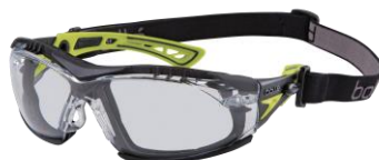
ガasket・ストラップ装着イメージ