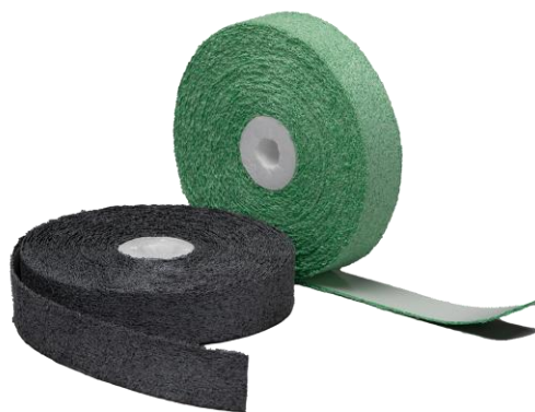
「NFテープ」（10m） 標準価格：9,370円（税別）

工場などで、持ち手部分を指定するマーキングとしても使うことができ、安全性だけでなく作業効率向上も期待できます。抗菌・防臭性能を兼ね備えた機能性素材で、握りやすい柔らかな感触も特長の一つです。カラーはグレーとグリーンの2種からお選びいただけます。