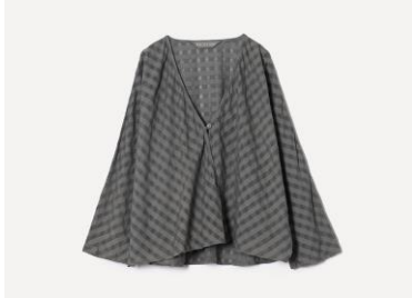
草木染め シャドウチェックドルマンローブ カラー：グレー（五倍子） 28,600円（税込）