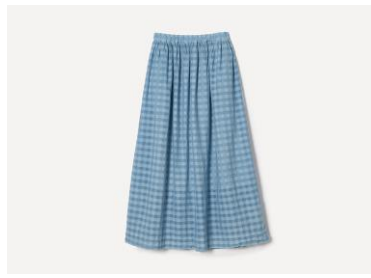
草木染め シャドウチェックギャザースカート カラー：サックス（藍） 33,000円（税込）