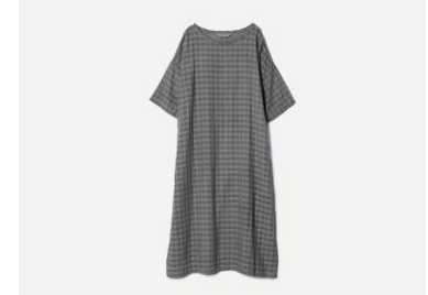
草木染め シャドウチェックサックワンピース カラー：グレー（五倍子） 33,000円（税込）