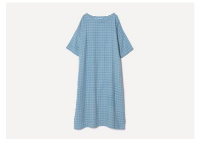
草木染め シャドウチェックサックワンピース カラー：サックス（藍） 33,000円（税込）