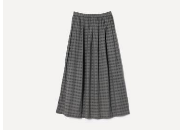
草木染め シャドウチェックギャザースカート カラー：グレー（五倍子） 33,000円（税込）