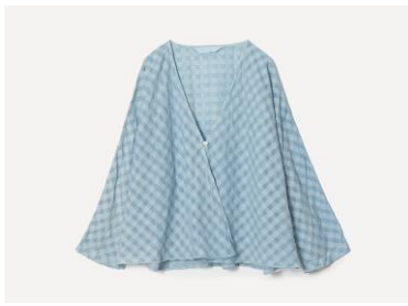
草木染め シャドウチェックドルマンローブ カラー：サックス（藍） 28,600円（税込）