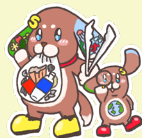
キャラクターコンテスト 最優秀賞 ごみひろいわんコース