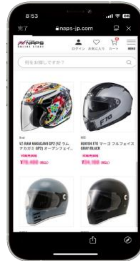
ナップスオンラインストア画面