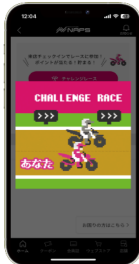
チャレンジレース画面