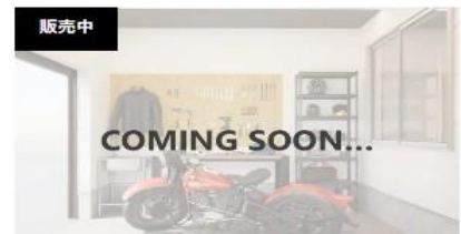
販売中 横浜市 神奈川県横浜市瀬谷区阿久和東 NAPS HOME 希望ヶ丘