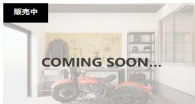
販売中 伊勢原市 神奈川県伊勢原市石田 NAPS HOME 愛甲石田