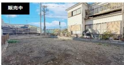
販売中 横浜市 土地 神奈川県横浜市戸塚区原宿 NAPS HOME 戸塚原宿（土地販売）