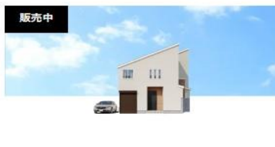
販売中 横浜市 3LDK 神奈川県横浜市南区唐沢 NAPS HOME 石川町