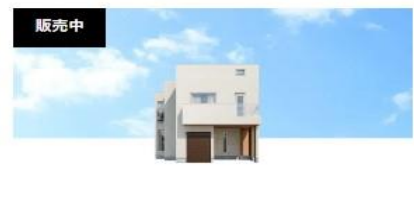
販売中 横浜市 3LDK 神奈川県横浜市港南区港南中央通 NAPS HOME 上大岡