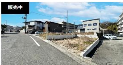
販売中 横浜市 4LDK 神奈川県横浜市港南区港南台 NAPS HOMEセレクト 港南台