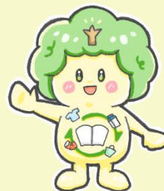
キャラクターコンテスト 最優秀賞作品 ソダチーノ